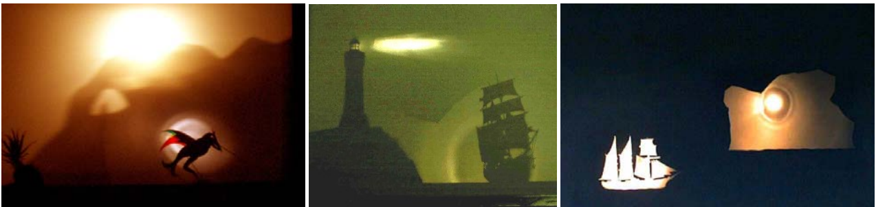
Trois exemples d'images créées utilisant diverses sources lumineuses : l'ombre de l'oiseau superposée à celle de l'éléphant ('L'Enfant d'Eléphant') ; le phare qui tourne dans la nuit avec la goélette qui glisse sur l'eau ; le navire et l'iceberg en ombre blanche toujours dans la nuit ('Le fils de Croquennec').

Maintenant, la source lumineuse est souvent d'origine électrique, lampes à incandescence, lampes halogènes ce qui permet de jouer plus facilement sur la distance entre l'objet (la marionnette) et l'écran permettant ainsi le grandissement de l'ombre tout en conservant une netteté suffisante. On peut également multiplier le nombre des sources lumineuses qui peuvent aussi être mobiles, colorées, d'intensité variable. Tout cela permet des effets susceptibles de contribuer efficacement à la narration.