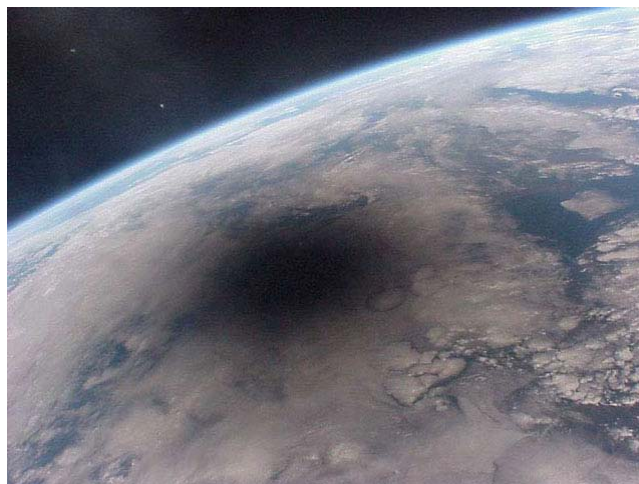
Eclipse de la Lune en juillet 1999 vue d'une station en orbite autour de la Terre, sans doute l'ombre la plus grande que l'homme pourra jamais percevoir

L' objet ou le corps , est ce qu'il est nécessaire d'avoir pour révéler la lumière et par voie de conséquence pour rendre possible la manifestation de l'ombre. Pour le théâtre d'ombres, il s'agira d'une marionnette, du corps ou d'une partie du corps du comédien. Mais cet objet ou ce corps capable de stopper la course vertigineuse de la lumière n'est pas encore suffisant pour que l'ombre se manifeste à nous ! Il faut un autre corps ou un autre objet pour que l'ombre du premier soit révélée. Par exemple, nous ne verrions jamais l'ombre de la Lune éclairée par le Soleil s'il n'y avait pas la Terre.