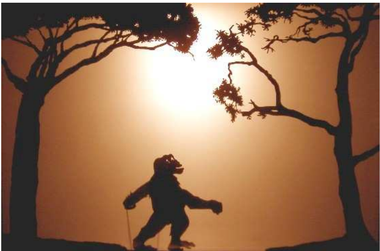
L'oncle poilu le Babouin