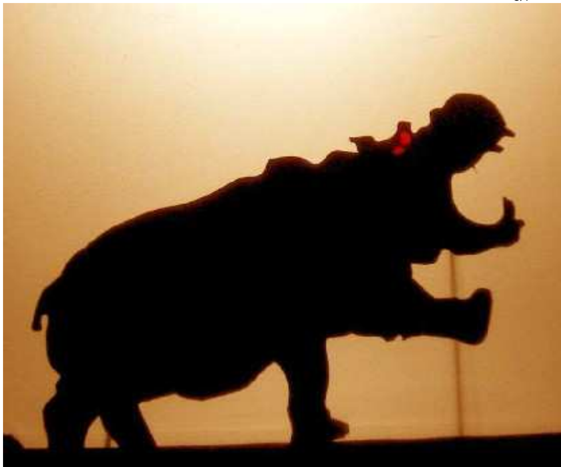
Le gros oncle Hippopotame