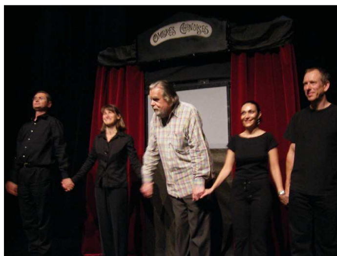
La troupe avec Michaël Lonsdale lors de la première

Traduction : Robert d'Humières (1869-1915)