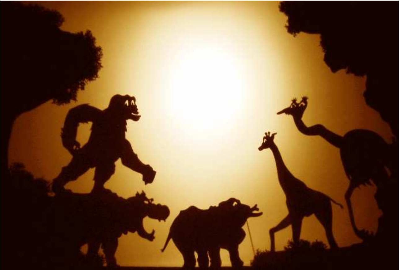
L'Enfant d'éléphant et son excellente famille