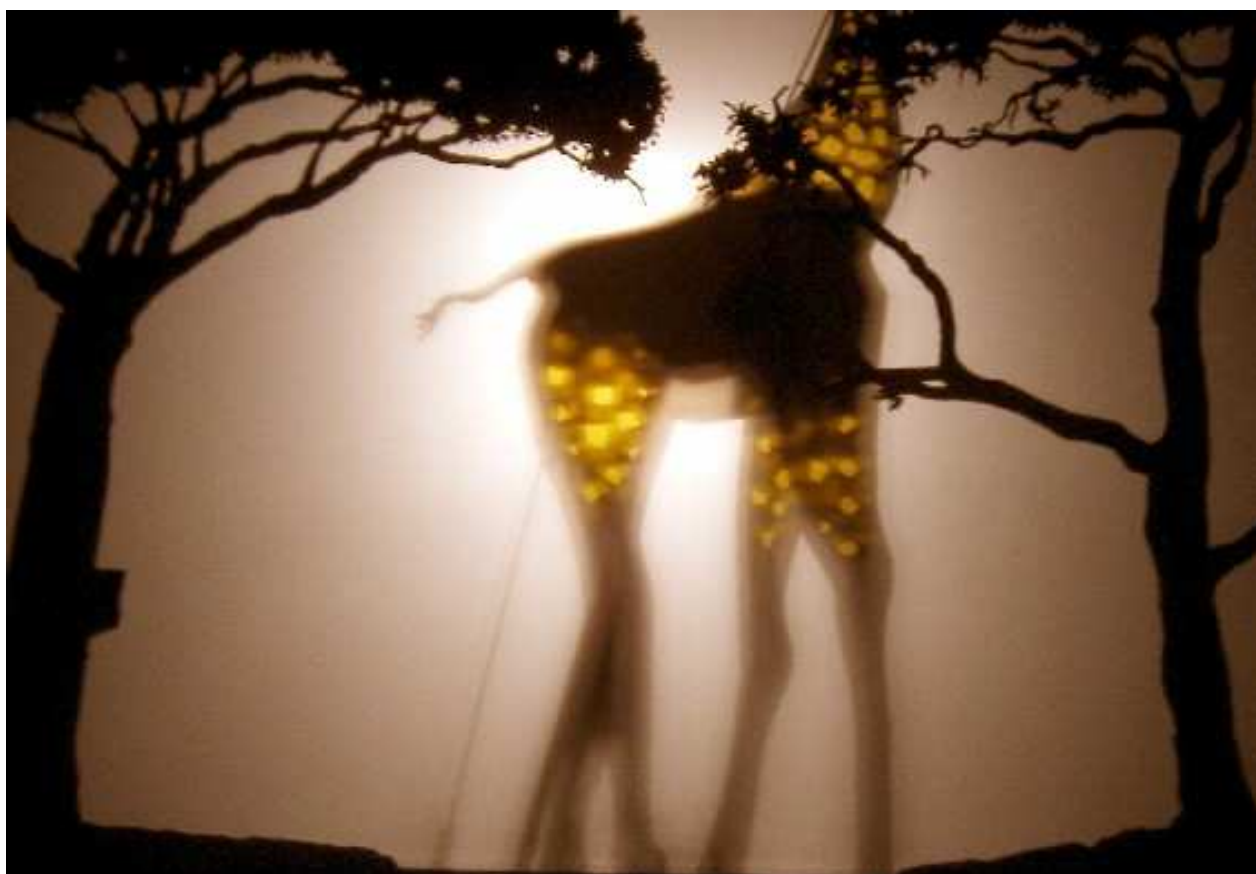
La grande tante Girafe