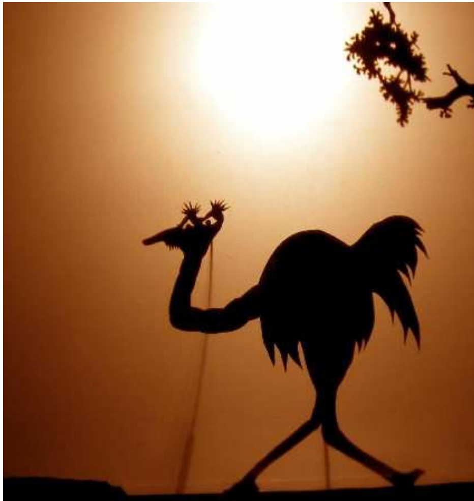
La grande tante l'Atruche,