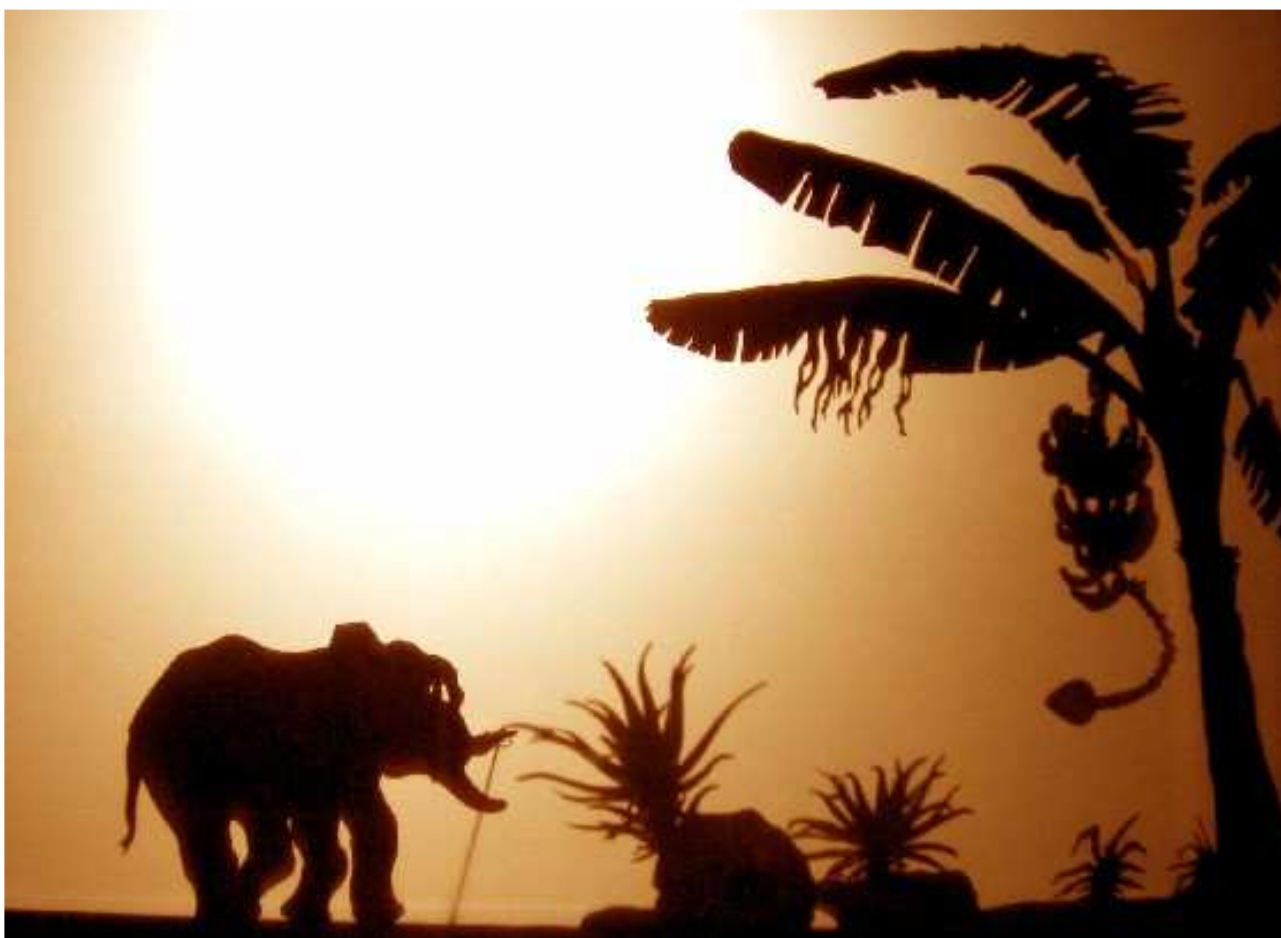
L'Enfant d'Éléphant est plein d'une insatiable curiosité