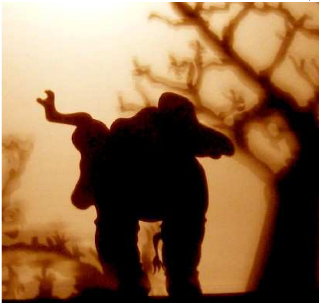
L'Enfant d'Éléphant jouant et folâtrant avec sa nouvelle trompe