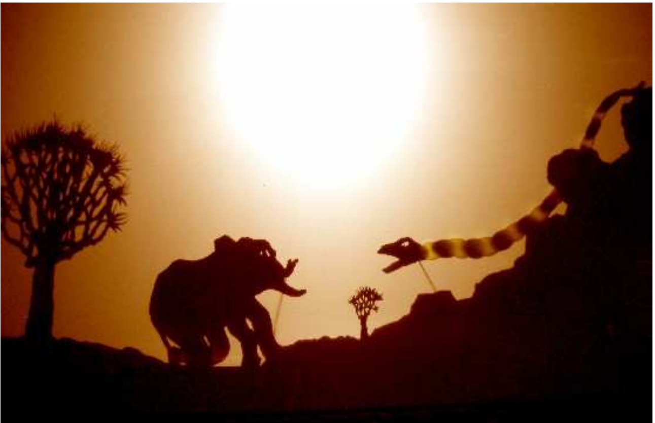
L'Enfant d'Éléphant avec le Serpent-Python-Bicolore-de-Rocher